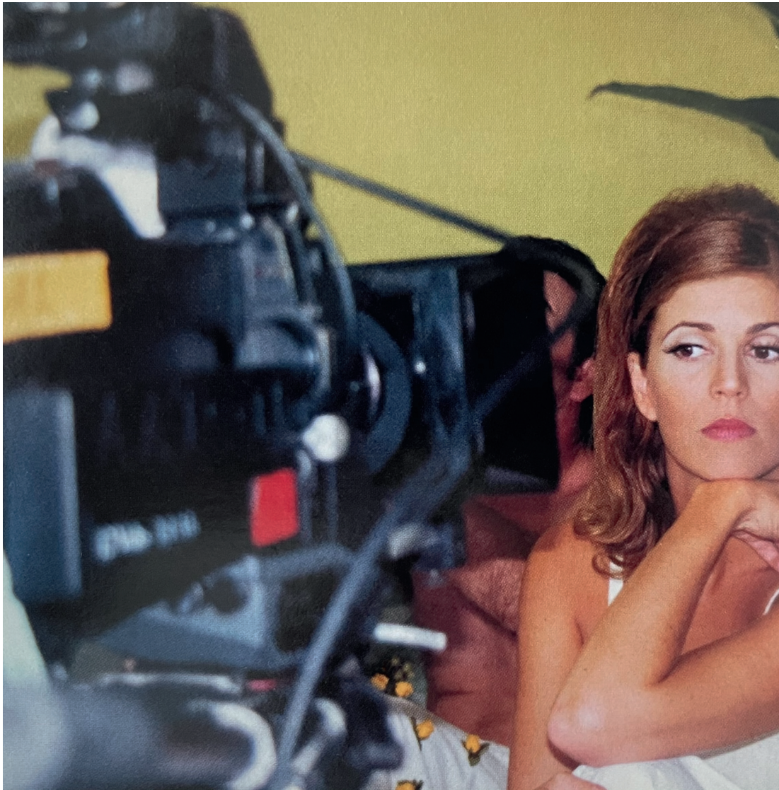
Rita va al supermercado Cortometraje a color, 35 mm 15 min 2000