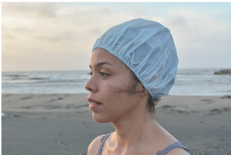
Acciones para no mojarse en la playa Instalación (fotografías, video-performance, libro) Dimensiones variables 2017