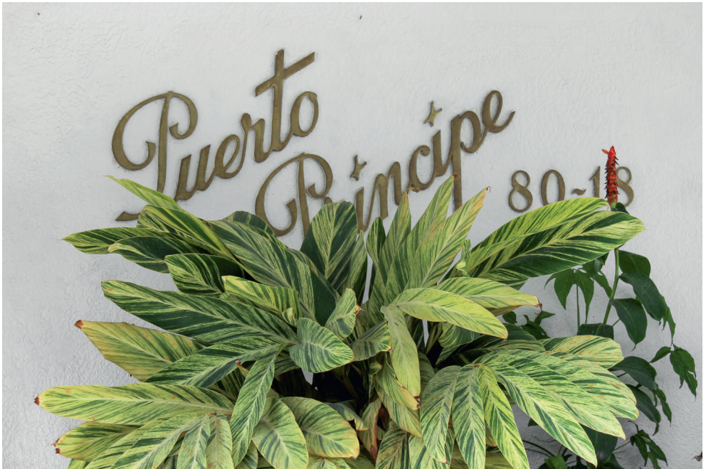
Geografía imaginaria Instalación (fotografías y dibujo a tinta) Dimensiones variables 2015

Vergara realizó estudios de Historia del Arte en la Universidad de Viena. Su interés por la imagen lo condujo a obtener un diploma en Bellas Artes con énfasis en la fotografía. A pesar de vivir en Europa, el artista ha mantenido un contacto cercano con la región, donde ha participado en varios proyectos, como Jagüey: Sobre un mismo horizonte en el Museo Mapuka (curaduría de La Usurpadora, Barranquilla, 2021), Hustler (Bogotá, 2017) y el XV SRA Zona Caribe Arte Corrosivo (Cartagena, 2015), entre otros. Además, su obra se ha exhibido en el Festival Foto Wien (Austria, 2022), en el Queer Museum (Austria, 2022) y en varias galerías.