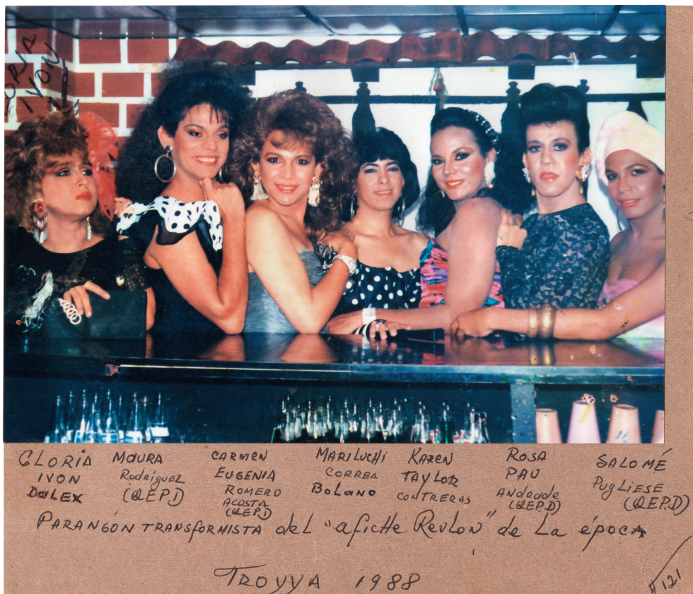
Parangón transformista del afiche Revlon de la época Recortes de periódico, revistas, fotografías, cartón y tinta 1971-2021