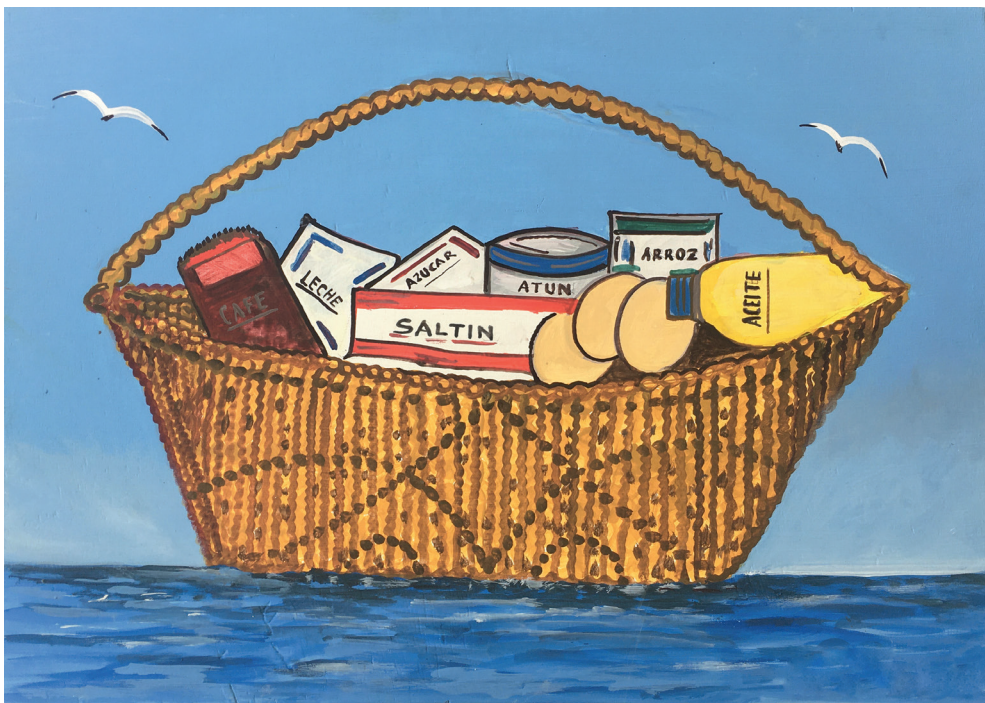
La canasta familiar Acrílico sobre madera Medidas variables 2020